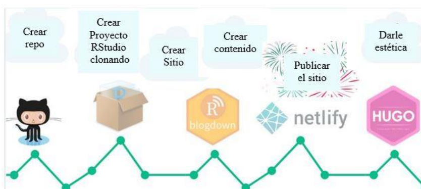
Fig. 3. Proceso de creación y publicación de un proyecto en R-Studio.

Los materiales creados pueden ser alojados, publicados y compartidos mediante estos repositorios de manera eficiente, estando interconectados con el software con el que fueron creados, por ejemplo R-Studio. Un ejemplo del proceso de creación y publicación de material educativo en este tipo de entornos se muestra en la Figura 3.