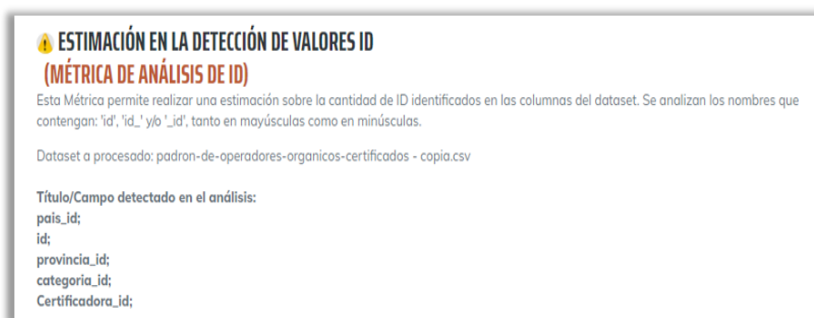
Fig.5. Métrica de Análisis de ID.