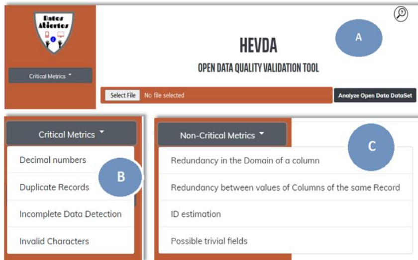
Fig. 2. Pantalla de inicio de la Herramienta HEVDA.

En la Figura 2, se muestra la pantalla inicial de la herramienta HEVDA (parte A, muestra el encabezado de ésta) con las métricas propuestas. Se puede observar la lista de métricas críticas (parte B) y no críticas (parte C) según el grado de importancia en calidad.