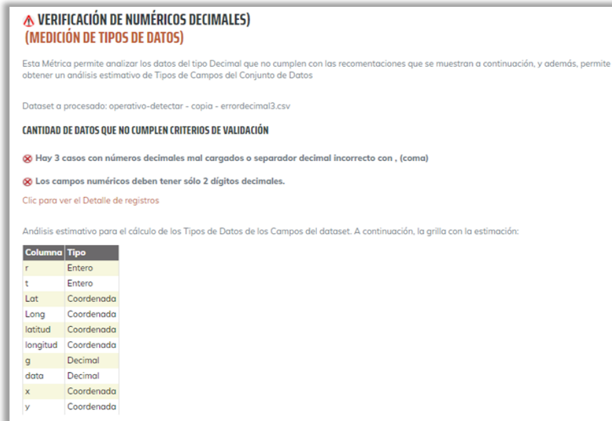
Fig. 3. Pantalla de Verificación de Números Decimales.

Posteriormente y de forma complementaria, se muestra un análisis estimativo para el cálculo de los tipos de datos de los campos del conjunto de datos analizados; esto se visualiza a través de una grilla que contiene: los nombres de los títulos de las columnas del dataset, y los tipos de datos detectados (según algoritmo interno propuesto en la herramienta HEVDA).