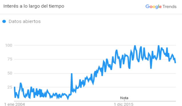
Fig. 1. Interés de búsqueda del concepto “Datos Abiertos” en todo el mundo desde enero 2004 a la actualidad.

prototipo de software para la evaluación de principios de datos abiertos que permitan, además, validar el cumplimiento de los datos abiertos.