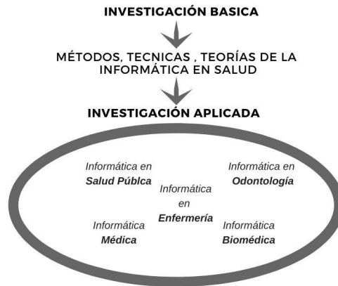
Fig. 2. Investigación básica en Informática en Salud y su aplicación en diferentes dominios.

La informática en salud se nutre de diferentes áreas del conocimiento (medicina, psicología, estadística, genómica, inteligencia artificial, robótica, ingeniería, ciencia de datos, bioinformática, etc.), generando un campo científico multidisciplinar. De las distintas áreas del conocimiento, toma sus metodologías para aplicarlas a la gestión de la información en salud [5]. Su campo de aplicación es la información biomédica, mediante diferentes sistemas realiza el proceso de gestión de la información para ser utilizada en la resolución de problemas y la toma de decisiones relacionadas con el cuidado de la salud.