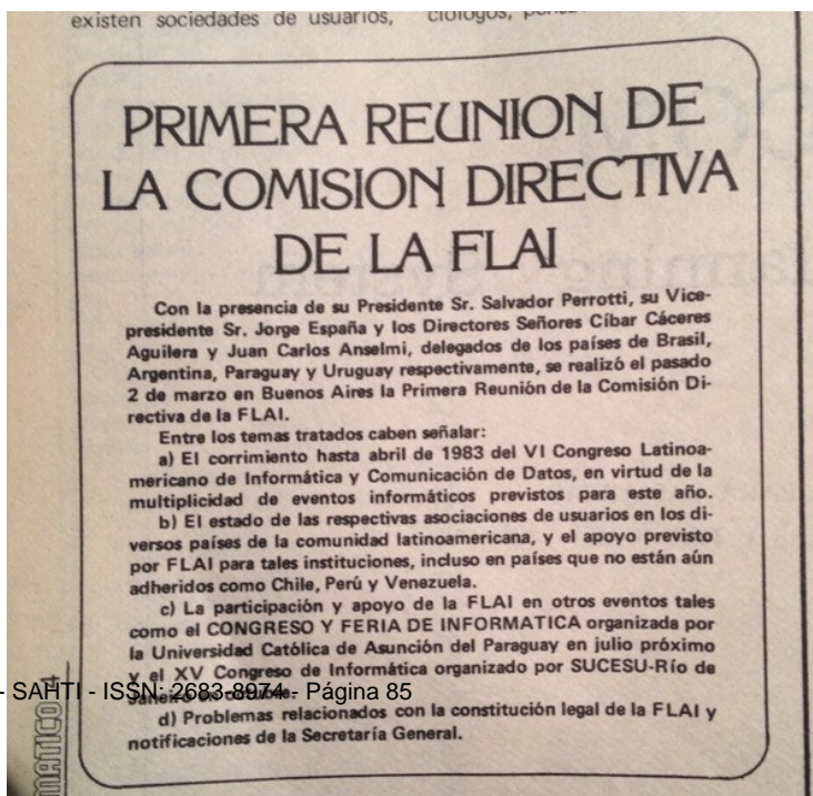
Figura 6: Carta de princípios de FLAI. Proceso 35 (janeiro 1982).