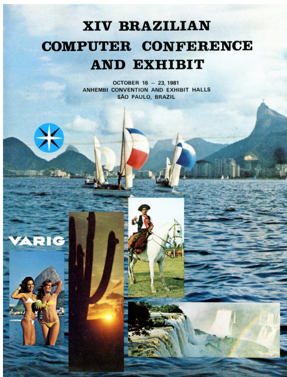
Figura 2: Carátula folleto publicitario del XIV Congreso Brasileño de Computación 1981 en San Pablo