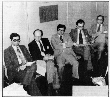
Alguns membros da diretoria da FLAI, em reunião no XIV CNI.

Usesco após a FLAI. Também está previsto em seus estatutos objetivos que deve perseguir e essas reuniões não deixam de ser alguns dos meios para obtê-los. Seus estatutos pregam, por exemplo, que a FLAI deve aumentar a cooperação entre os usuários latino-americanos de informática e promover a ampliação do intercâmbio de informações entre eles. Deve, também, procurar, através dos meios ao seu alcance, acelerar o desenvolvimento científico e tecnológico da área, além de contribuir para o bem-estar sócio-econômico dos países associados. Além disso, a entidade deverá promover publicações relacionadas à área; promover e realizar congressos, seminários e simpósios com o objetivo de divulgar novas técnicas, produtos e equipamentos; defender os interesses de suas associadas, assistindo-as pelos meios a seu alcance; exercer qualquer atividade econômica relacionada direta ou indiretamente com seus interesses; promover a organização de Federações similares à FLAI em outras regiões do mundo, ajudando as nações a organizarem-se e desenvolverem-se em termos de informática, e incentivar os países do Caribe a participar regularmente de suas atividades; e promover na América Latina o desenvolvimento de serviços de informática e, particularmente, de "software" básico e de aplicação.