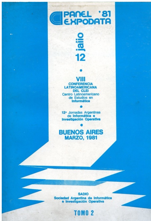
Figura 1: Afiche PANEL '81