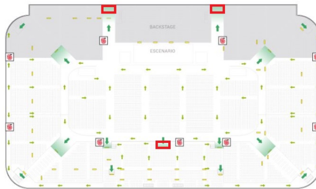
Figura 2. Salidas cerradas en el escenario B

dido para mayor comodidad de sus artistas. A partir de esto, las 2 salidas a los costados del Backstage quedan bloqueadas debido a un cambio en la estructura necesaria. Además, se requiere que las consolas de sonido se ubiquen frente a la puerta de la salida para la platea que está sobre el SuperPullman, quedando así inhabilitada. Las indicación de las salidas de emergencia cerradas en este caso se puede apreciar en la Figura 2, marcadas con un rectángulo de color rojo.